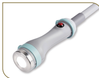
Głowica do zabiegów głębokich

Głowice SMART w technologii ONDA emitują fale elektromagnetyczne o częstotliwości 2,45 GHz, które są idealnie absorbowane przez komórki tłuszczowe, przenikają przez naskórek i skórę właściwą, docierając w głębokie partie skóry. Dzięki temu aż 80% energii jest skupione na komórkach tłuszczowych, a jedynie 20% to powierzchniowy efekt termiczny.