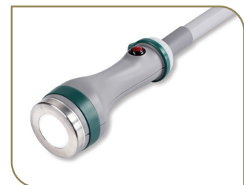
Głowica do zabiegów powierzchniowych